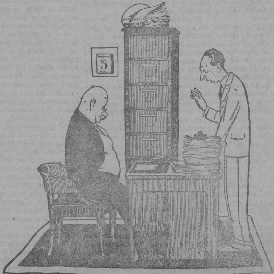
—Dice usted que ayer estuvo en cama y que no pudo venir a la oficina. Sin embargo, le vi tranquilamente por la calle.

El jefe del aeródromo comparece, y asegura haber notificado nuestra venida al comandante de la fortaleza. De esto no sabe nada el sargento. Lo que sabe perfecta-