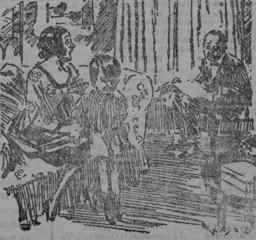
-Pero niño, esas palabras no se dicen. ¿A quién has oído tú esas groserías? -A papá, cuando se enfada contigo.