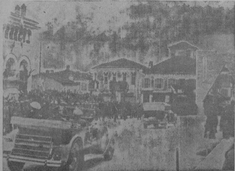
A bordo del crucero «Helli», se ha trasladado a Jannina, el Rey Jorge de Grecia con motivo de las fiestas del 13 aniversario de la toma de Bizami.