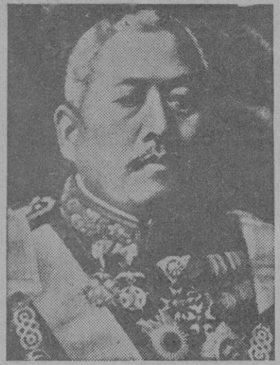
El almirante Saito Makoto, víctima de la revuelta

Nació en 1858, de familia pobre, entrando en la Academia Naval y siendo nombrado subteniente de Marina en 1902. Participó en la guerra chinojaponesa de 1914 y en el conflicto rusojaponés de 1904. Recibió el título de conde en 1905. Fué ministro de Marina durante nueve años, alcanzando el título de almirante en