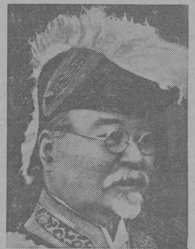
El señor Takanashi, ministro de Hacienda del Japón, que ha sido asesinado por los revoltosos

hashi, que ha sido asesinado durante el golpe de Estado del Japón, fué presidente del partido Seiyūkai y recientemente había mantenido relaciones con los elementos liberales de la nación. Por otra parte, elementos chauvinistas habían interpretado como un insulto al grupo militar ciertas manifestaciones suyas sobre el presupuesto, según las cuales no existía ningún peligro de agresión contra el Japón por parte de ninguna potencia extranjera. Por lo tanto el primer deber del Gobierno era procurar el enriquecimiento del pueblo japonés. Como los periódicos acogieron cordialmente estas declaraciones del ministro, que fueron destacadas en primera plana y comentadas favorablemente, cada vez aumentó más la enemistad de los militares contra él.