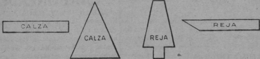
RECORTES Y PLETINAS PARA FABRICACIÓN DE HERRADURAS