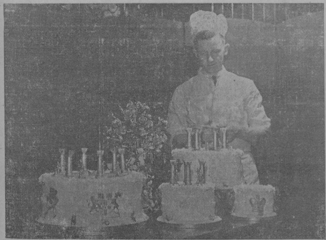
LA BODA DEL DUQUE DE GLOUCESTER.—El magnífico pastel que figuró en la comida de bodas del duque de Gloucester con Lady Alice Scott, que pesaba 150 libras, era blanco con adornos dorados emblemas de las familias de Inglaterra y Escocia.

Toda la correspondencia literaria y administrativa para EL DIA debe ser dirigida al Apartado de Correos número 22