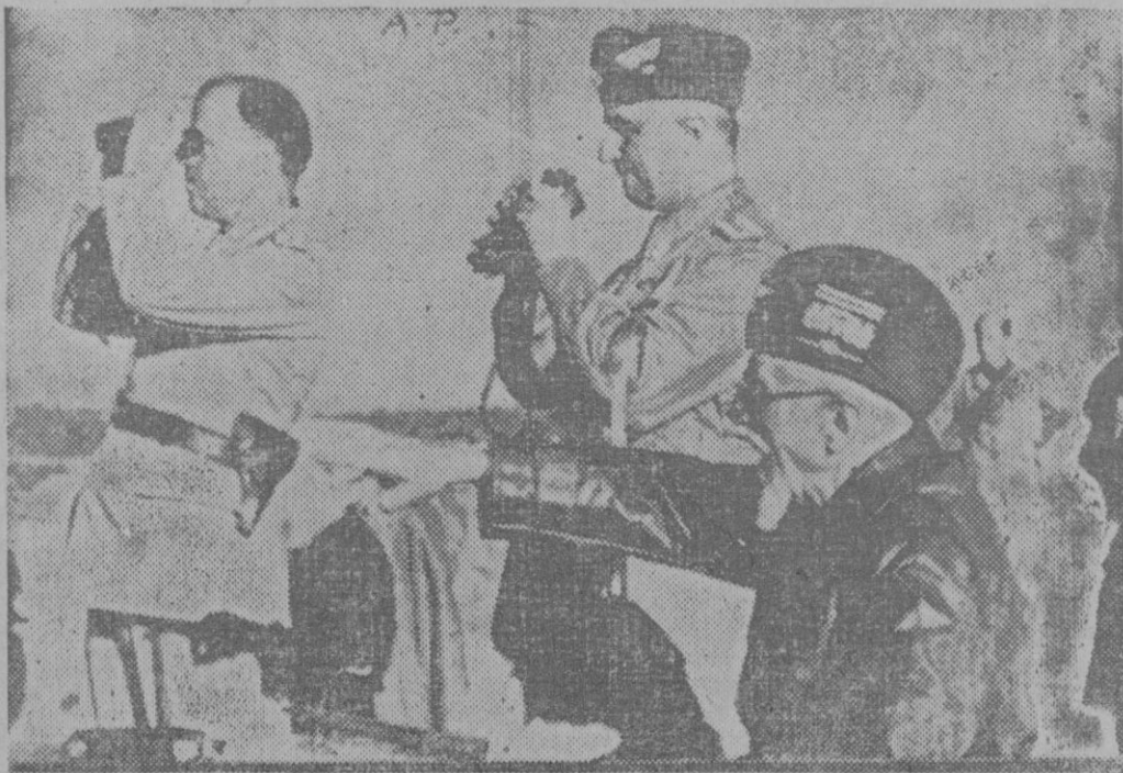
El General de Bono en el escenario de la guerra

Sería curioso saber si los fabricantes de sombreros apercebidos del fenómeno sirven sus artículos con la consiguiente previsión de ideas a cada uno de sus clientes porque si la fabricación se hace en serie la profesión de vendedor al detall se hace complicadísima. ¿No tendrán estos hombres que suplir su tacto cuantitativo por otro cualitativo infinitamente más vario y complicado? El sombrero futuro a cambio de no serle preciso el tacto especialísimo para ofrecer un tamaño aproximado con arreglo al volumen encefálico del comprador tendrá que proveerse de ciertos conocimientos psicológicos que le permitan adivinar el pensamiento y la filiación política de su cliente con solo pasarle la vista por el ángulo facial.