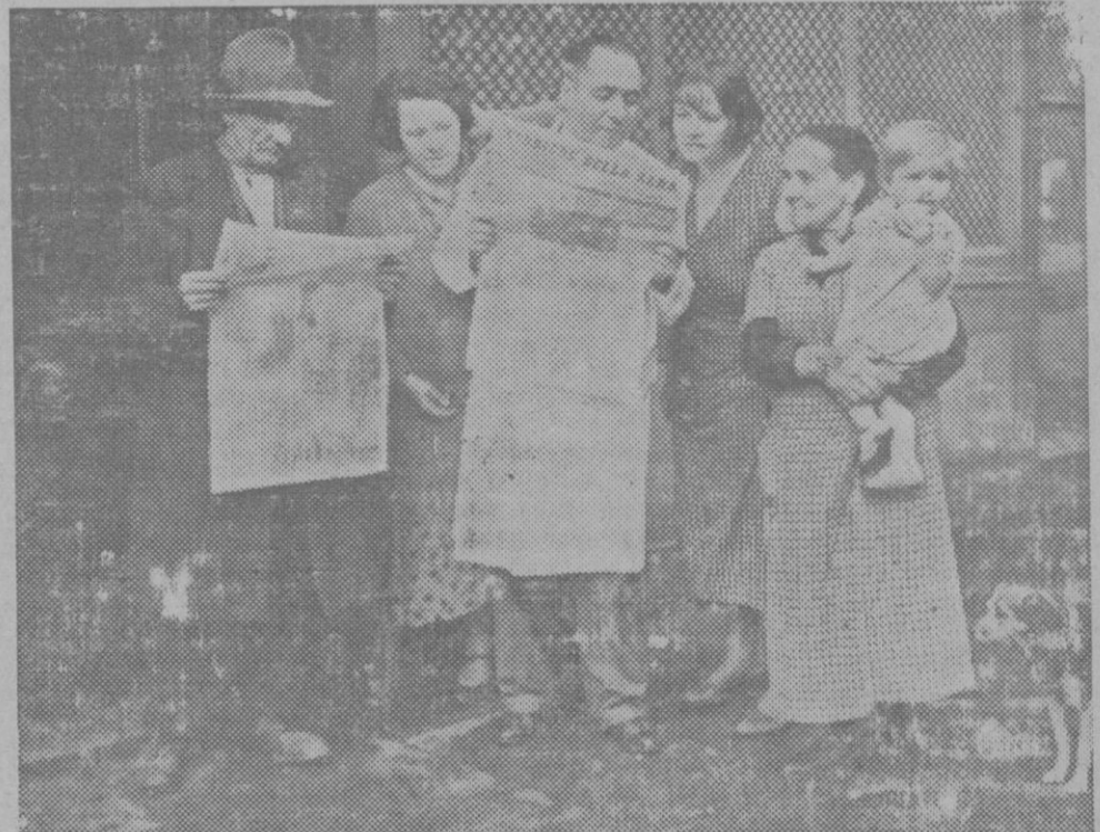
LOS ITALIANOS DE LONDRES.—Italianos residentes en Londres comentando las últimas informaciones de la guerra