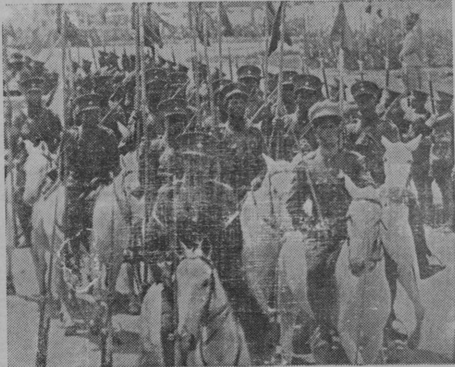
LOS LANCEROS DE HAILE SELASSIE.—Los lanceros del emperador llegando a la capital para las fiestas de Mascaí