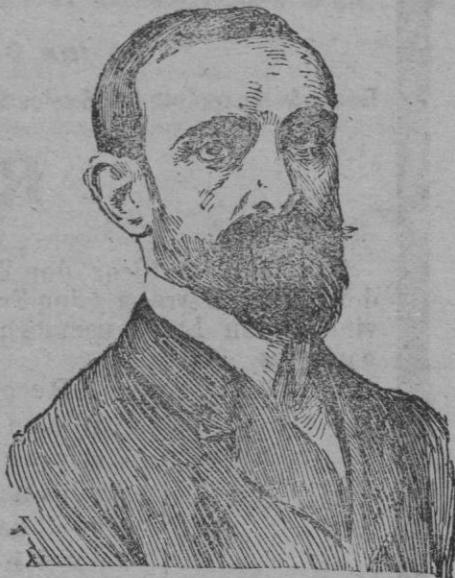
Don Francisco Gambo, nuevo ministro de Hacienda