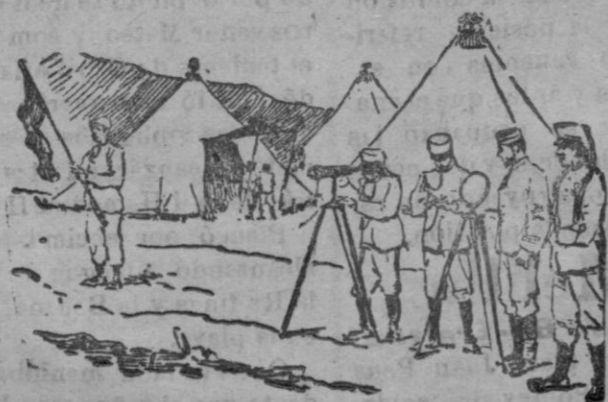
El heliógrafo del Monte Gurupú, comunicando con el general Navarro en el Monte Arruit