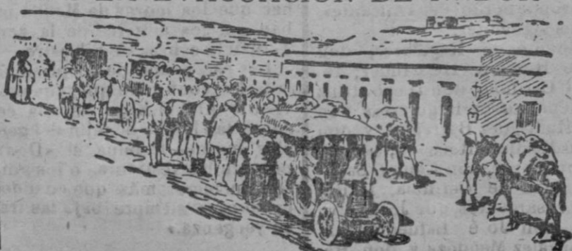
Llegada de un convoy de enfermos y heridos a Melilla