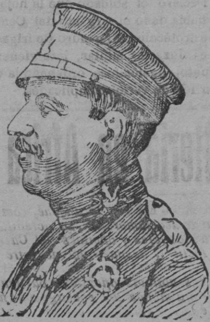
D. José Sanjurjo y Saonell, bizarro general que con gran denuedo y acierto combatió a la harka enemiga en el territorio de Melilla