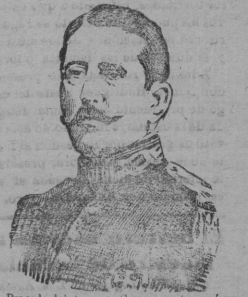
Procede del Arma de Caballería, ingresó en la Academia en 1886. Se batió en Cuba, y en la campaña de África ganó popularidad y prestigio con la famosa carga de Taxdir...