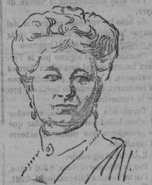
Augustía Victoria, ex emperatriz de Alemania que ha fallecido en Dons (Países Bajos)