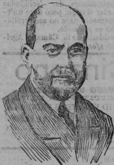
Don José Maestro, ex ministro de Abastecimientos, n. mbrado gobernador del Banco de España recientemente.