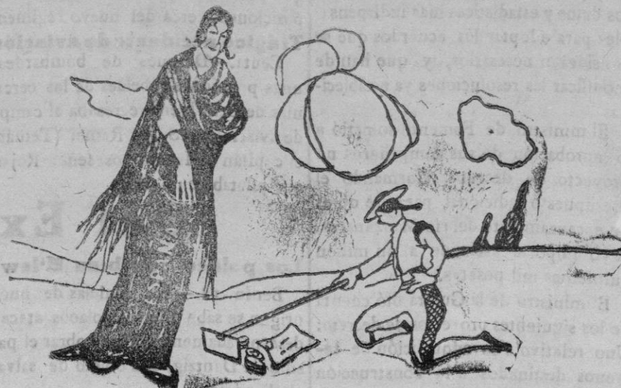
La madre.—Niño, deja el juego y vamos a ver si encontramos pan.