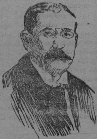
Herr Noske, ministro de la Defensa de la Socialdemocracia alemana