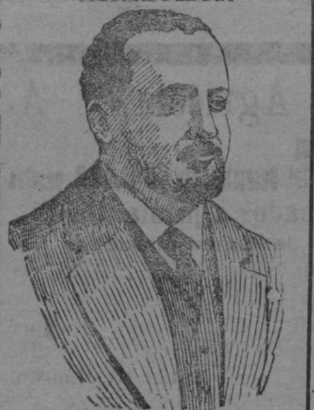
Don Pedro Poggio, nuevo director general de Primera Enseñanza