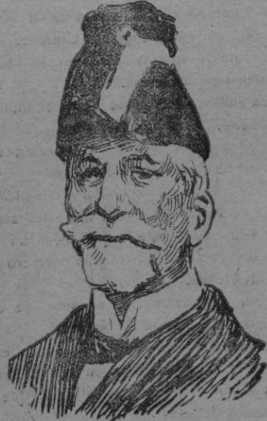
El general Flórez, ministro de Marina.