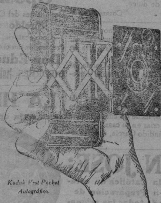
Kodak Vest Pocket Autográfico.

El Kodak se aprende a manejar en media hora. Se eliminan las molestias del cuarto oscuro en todas las operaciones, y hay Kodaks de todos los precios, desde 48 pesetas en adelante.