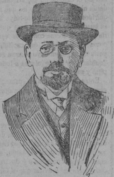
El profesor Borckardt, gran político, demócrata alemán que figura en el Gobierno provisional.