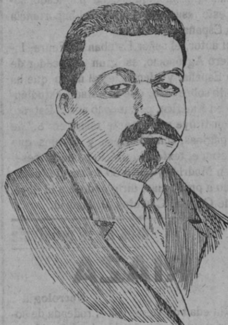
FEDERICO EBERT, presidente del Gobierno provisional alemán.