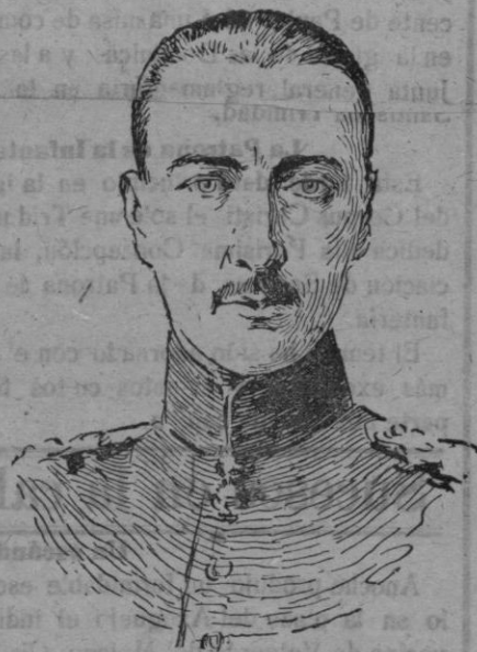
El Soberano de Wurtemberg, que ha renunciado la corona con todos sus derechos.