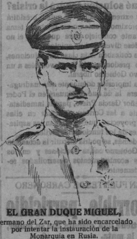
EL GRAN DUQUE MIGUEL, hermano del Zar, que ha sido encarcelado por intentar la instauración de la Monarquía en Rusia.