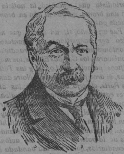
MR. LLOYD GEORGE,

presidente del Consejo inglés que se encuentra en París con motivo de las conferencias interaliadas