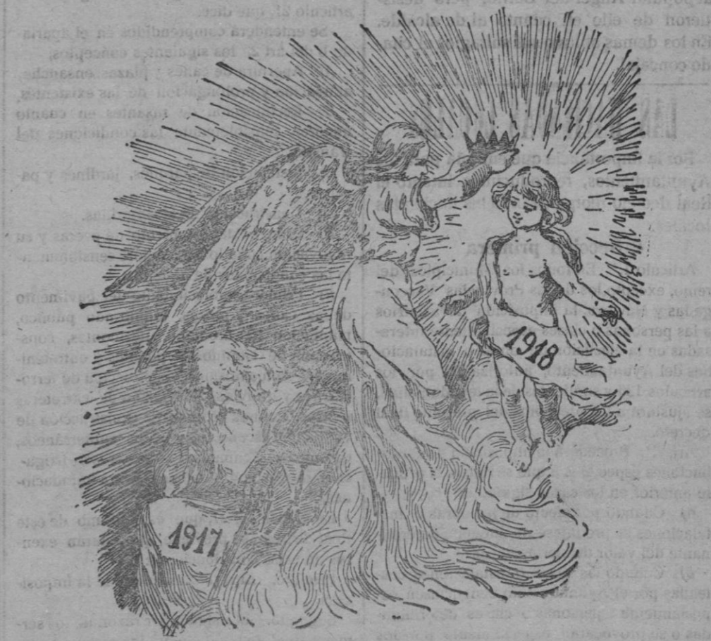
ALEGORÍA DE 1918

Acta de nacimiento del Registro civil, legalizada; certificado de buena conduc-