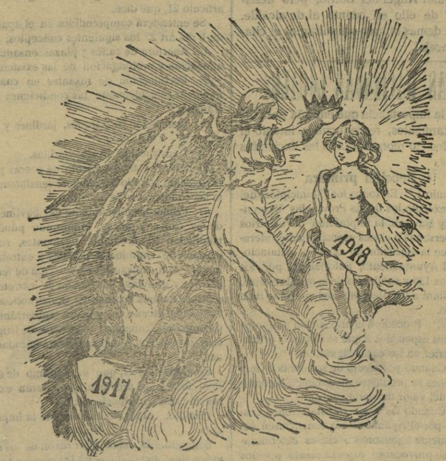
ALEGORÍA DE 1918

Acta de nacimiento del Registro civil, legalizado; certificado de buena conduc-