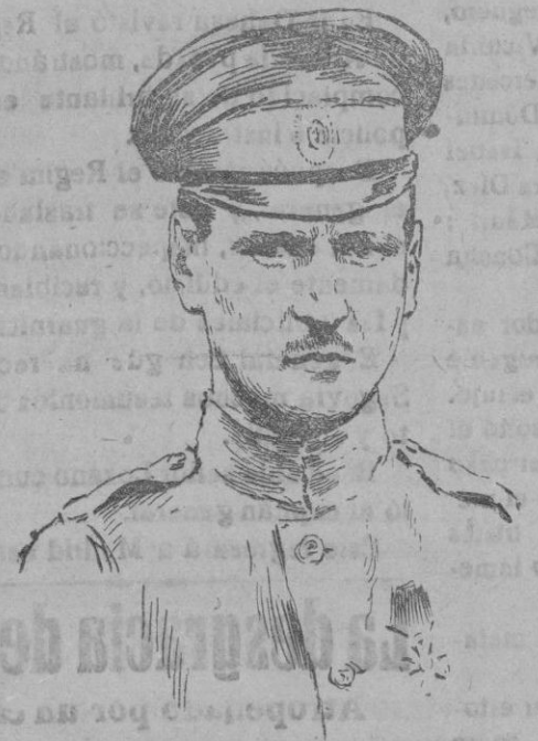
El gran duque Miguel de Rusia acusado del complot contrarrevolucionario y detenido en la fortaleza de Pedro y Pablo.