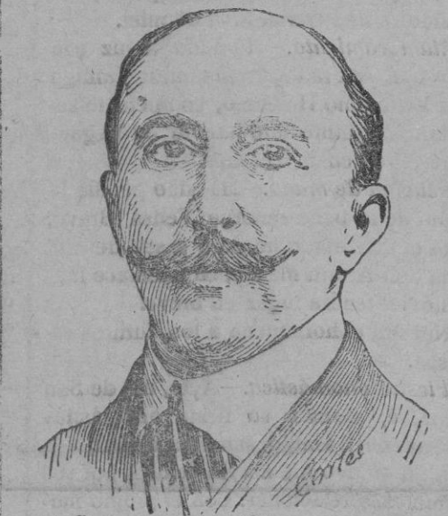
SEÑOR MARQUÉS DE LEMA, nuevo ministro de Estado.

Los empeños han experimentado una baja de 1.500 pesetas, de lo cual nos alegramos, porque es un síntoma elocuente de que el verano no se presenta mal para las clases menesterosas.