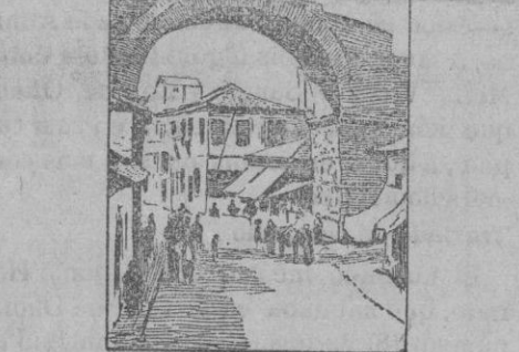
SALONICA.—La torre Veneciana.—El arco de Constantino.