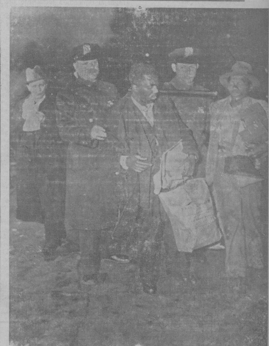
PRIMERA FOTOGRAFIA ORIGINAL DE LA SUBLEVACION NEGRA EN HARLEM.—En el barrio negro de Harlem en Nueva-York se armó un grave motin causado por una pelea sin importancia en una de las tiendas de aquel barrio. Los escaparates fueron bombardeados con piedras y tuvo que acudir la policía para tomar fuertes medidas. Aquí vemos la detención de dos de los sublevados.