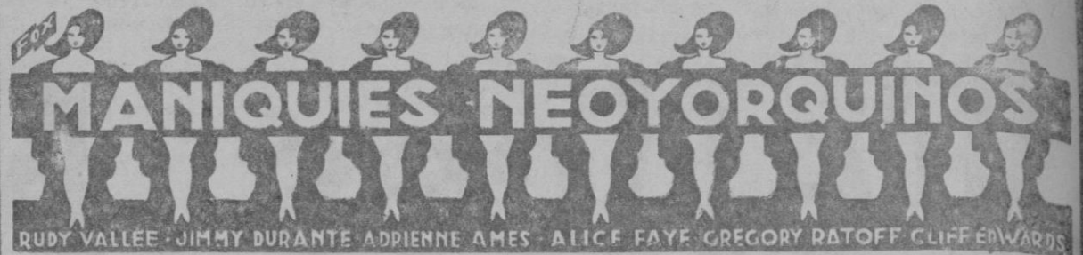
RUDY VALLEE - JIMMY DURANTE - ADRIENNE AMES - ALICE FAYE - GREGORY RATOFF - CLIFF EDWARDS

Una de las mejores revistas de George White