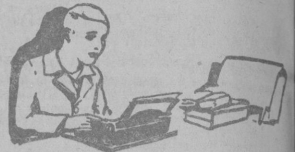
Para el estudiante