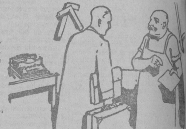
Para el Industrial