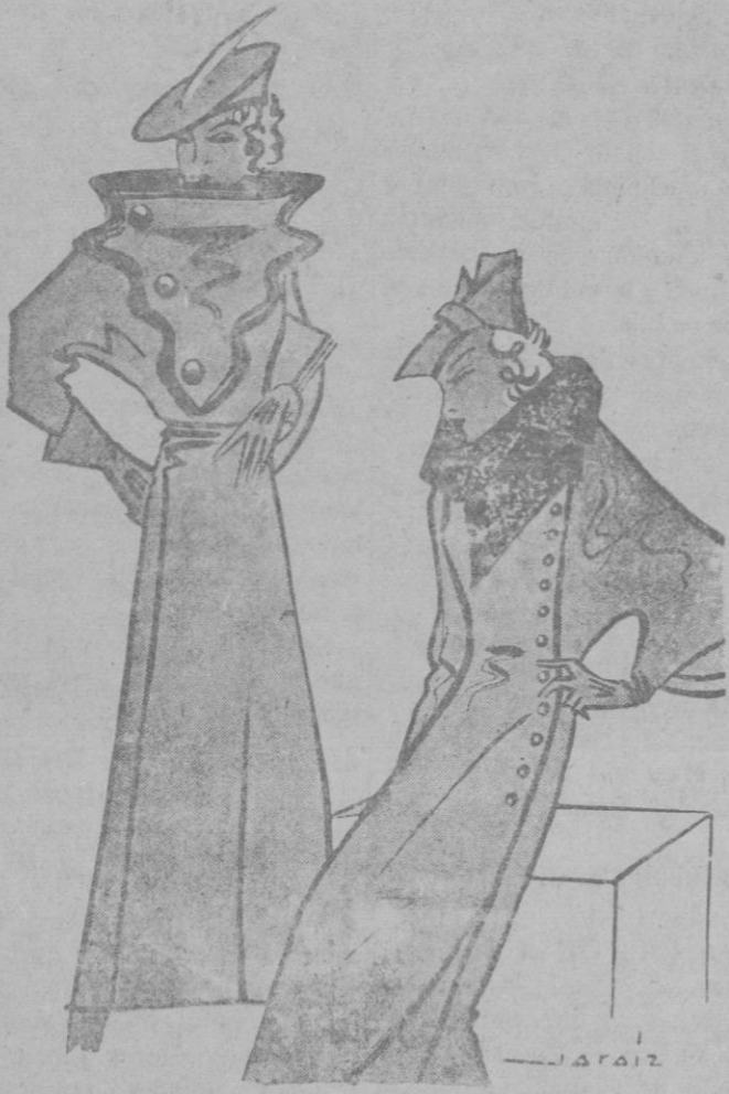
Sombreros y abrigos modernos. Nota de París.