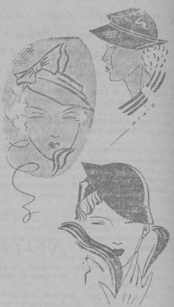
Sombreros muy de actualidad. Nota de París.