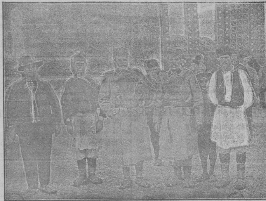
GRUPO DE RESERVISTAS SERBIOS

las, mediante el pago de la cuota militar, deben conocer para cuando sean llamados á concentración y destino á cuerpo, la obligación que tienen de acreditar la instrucción militar que determina el artículo 278 de la citada ley.