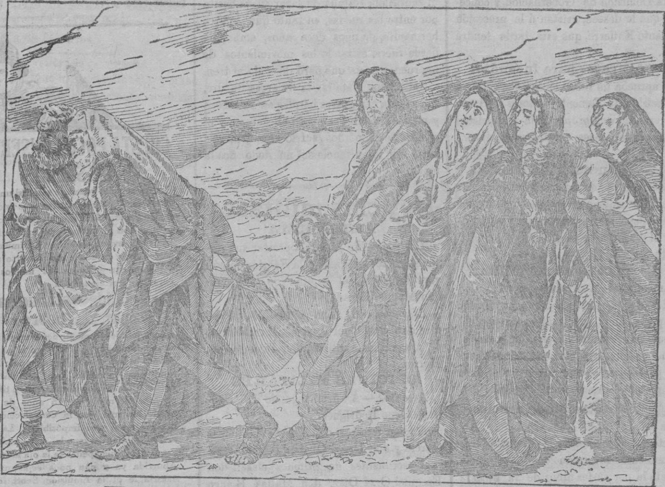
EL ENTIERRO DE JESÚS