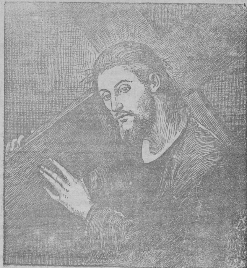
JESUS CON LA CRUZ A CUESTAS

El sol esconde su luz; el mundo gira rehacio: ¡Una cruz llena el espacio y un mártir llena la cruz! Envuelto en negro capuz, el pecado tiembla y gime. ¡Dios al pecador redime, detiene el ave su canto, y una madre suelta el llanto