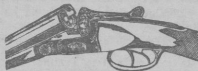
Muestra a menor precio que el de costumbre. Facultad de devolver.

Es de justicia y hasta de conveniencia patriótica.