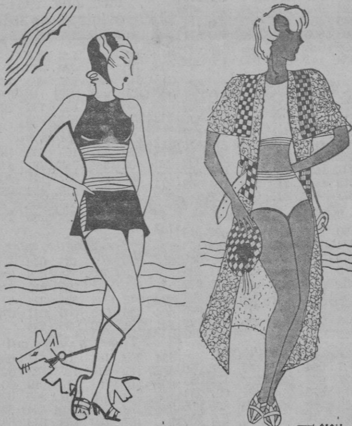
Nuevas siluetas de playa. El «maillot» se transforma y se hace cada día más reducido.

Las uñas se rompen frecuentemente. Esto es a veces producido por el frecuente uso del barniz, que las reseca. Para que las uñas sean más flexibles y no se rompan amenuado, procédase a quitarlas el barniz