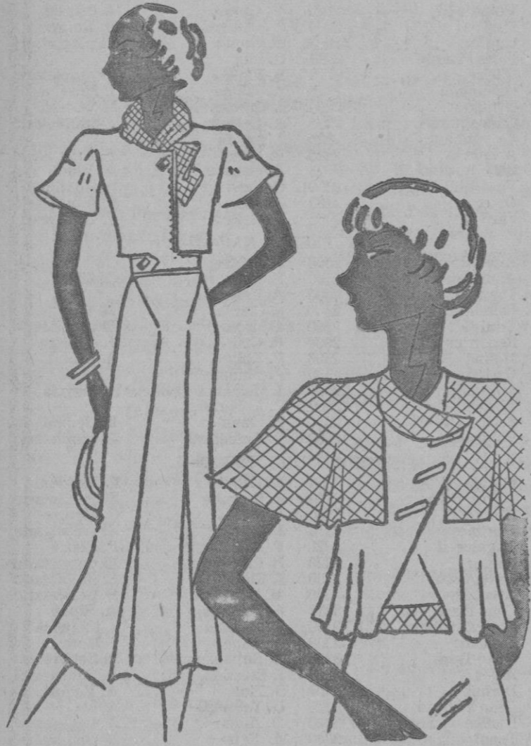
Trajecitos de sport confeccionados en lanas.