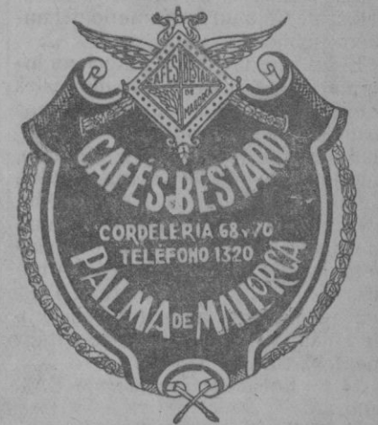
Nombre y marcas registrada.