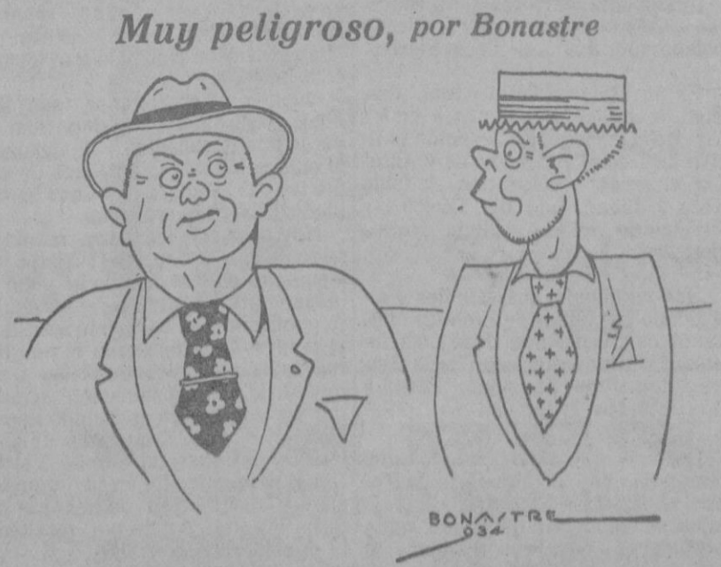
«Las cháticas son peligrosas. Onofre está gravísimo a causa de eso. —Demonio!... haces bien en decirlo; creyendo y que las mujeres de Asia eran más dulces, iba a casarme con una japonesa. Ya me desdigo.»