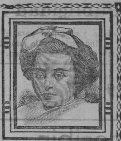
Barcelona, 11 Febrero 1908.