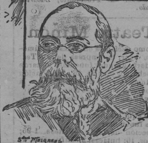
MR. TAPT, ministro de los Estados Unidos.—EL VIZCONDE DE AOKI, embajador del Japón en Washington.

La escuadra de los Estados dará la vuelta a América en 178 días, dirigida por el almirante Evans que va en el acorazado Connecticut que arbolaba el pabellón insignia.