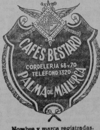
Nombre y marca registradas.