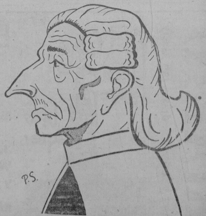
El Bedel del Cabildo