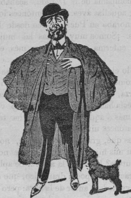
1.—Antes del estreno.