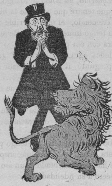
2.—Despues del éxito.