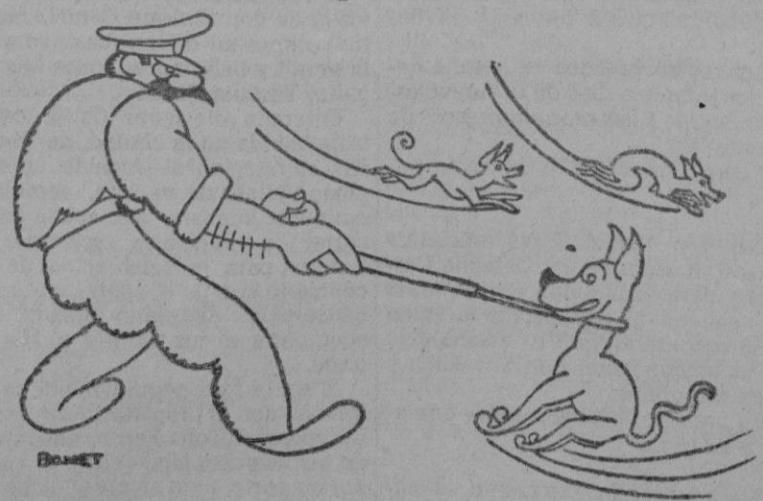
El lacero.—Me parece que mañana, en vez de lazo, tendré que traer a mi perra.