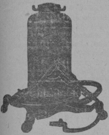
Equipo Engrase con pistola automática CRACO