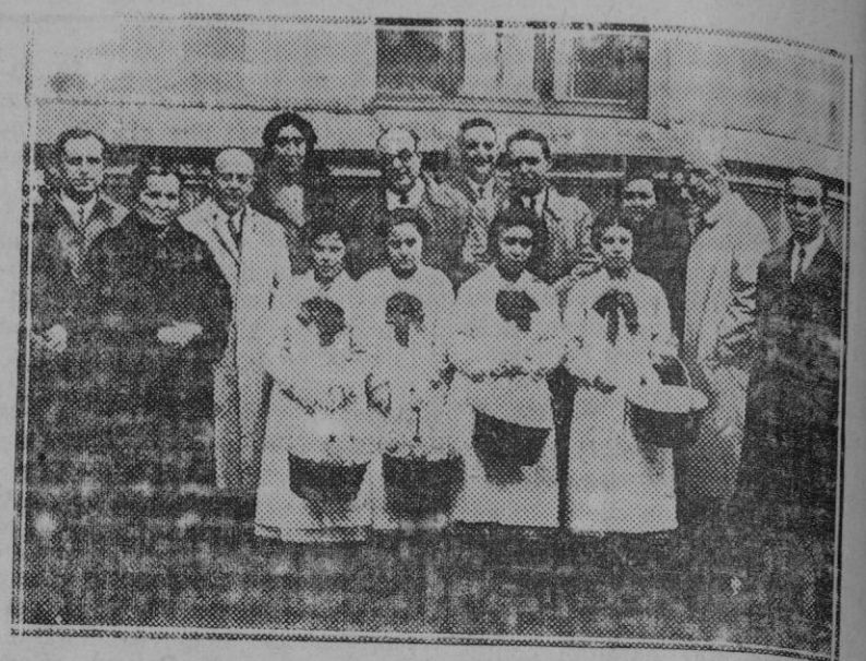
BILBAO: Los concejales con las maestras y maestros del barrio de Olaveaga, en el que se inauguró una cantina escolar. En primer término las niñas que sirvieron la comida