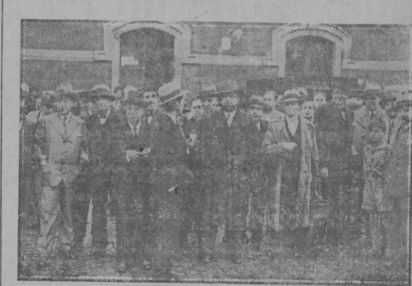
Llegada de los dipatados gallegos a La Coruña, donde se reunieron en Asamblea para redactar el texto definitivo del proyecto de Estatuto de la región gallega