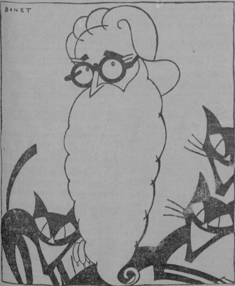
El ilustre escritor, «ese gran don Ramón de las barbas de chivos», castizo, liberal y, ahora, por disposición del Gobierno, conservador. Eso es: Conservador general del tesoro artístico nacional. Nombramiento muy loable porque todavía hay, en España, bastante que conservar.