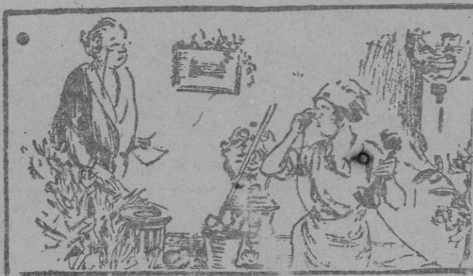
La señora.—¿Consiguí comunicarse con la carnicería? La sirvienta.—Creo que sí, señora, porque me parece oír el ruido del serrucho.

Advertimos a nuestros comunicantes que toda la correspondencia relativa al periódico, excepto la administrativa, debe dirigirse a la Dirección del mismo