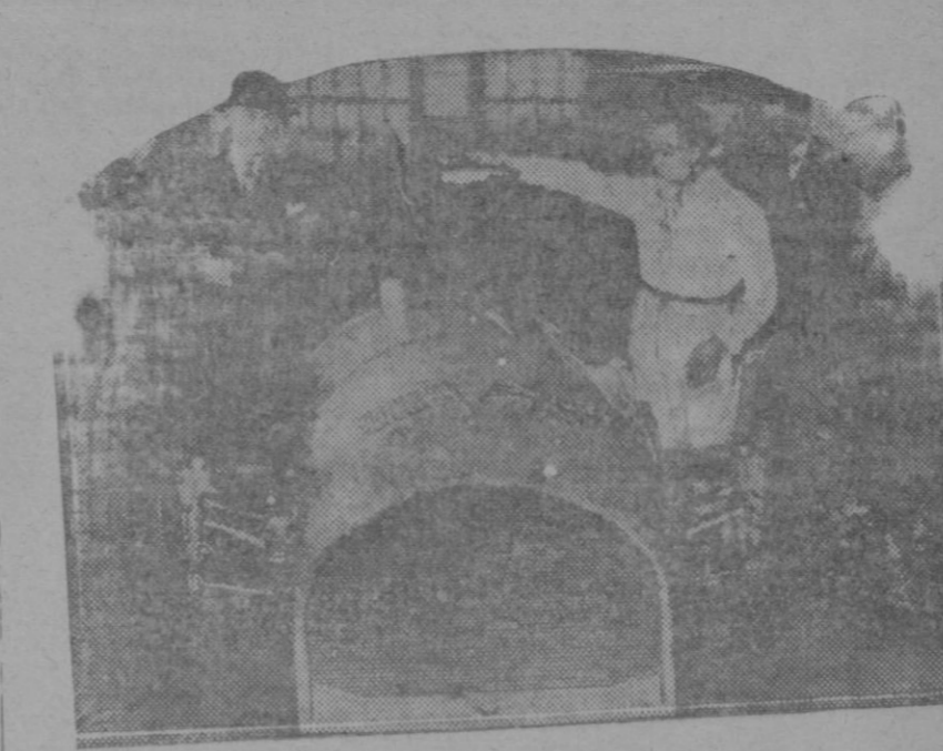
Campbell y su mecánico con el «Pájaro azul», en el que ha batido el record del mundo de velocidad