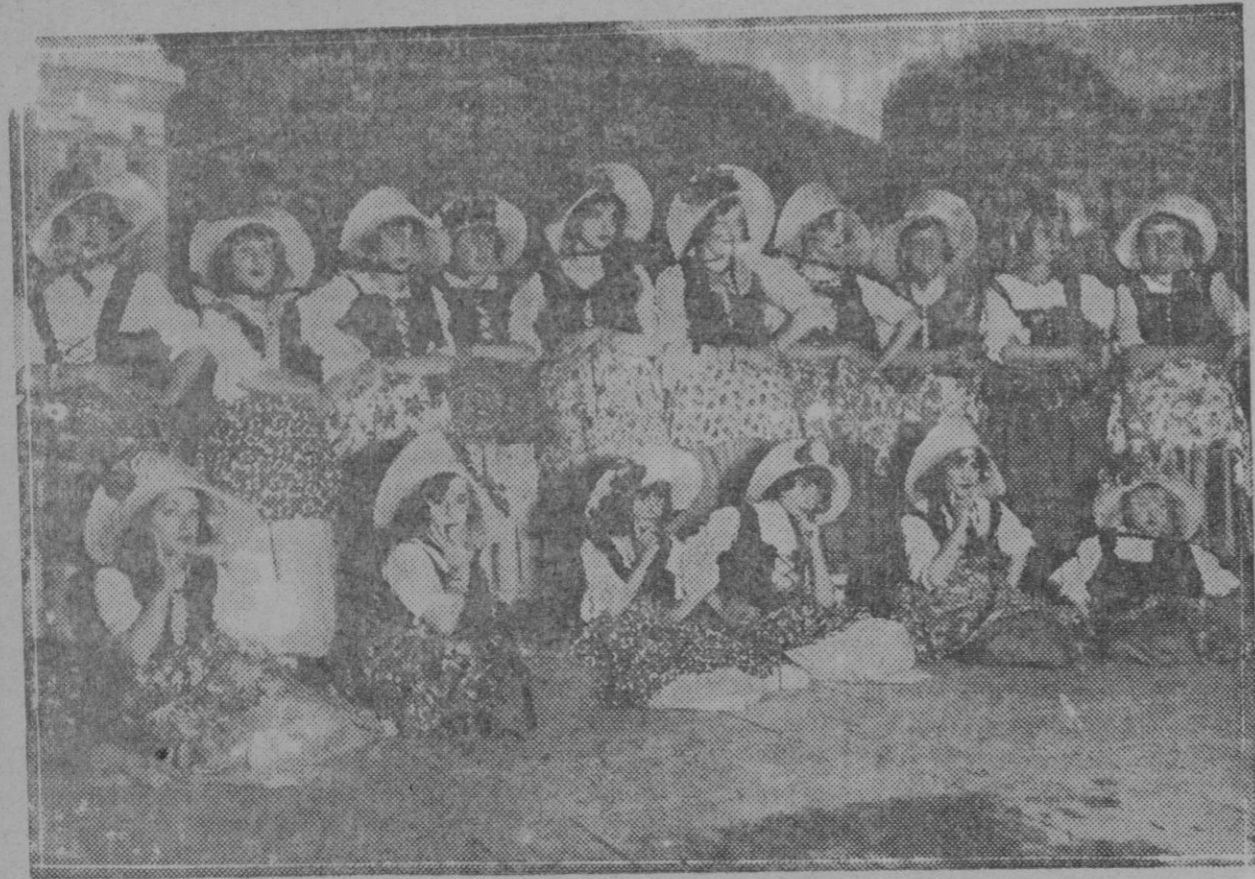
Alumnas del Conservatorio de Música que cantaron el número de «Las espigadoras» en la fiesta celebrada en el teatro-circo a beneficio de las Casas de Misericordia y del Exósito