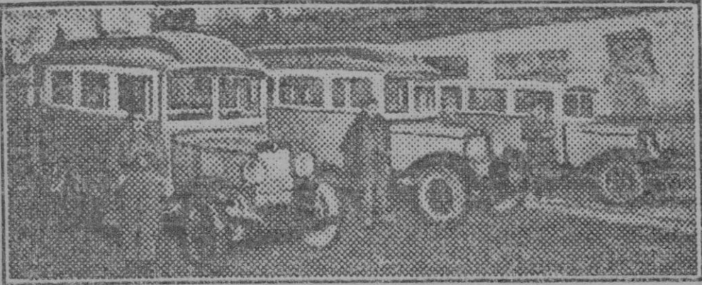
Las siete de la mañana. Preparados para empezar el servicio diario

SOLO ES LEGITIMA EL AGUA VENDIDA EN SUS BOTELLAS PRECINTADAS